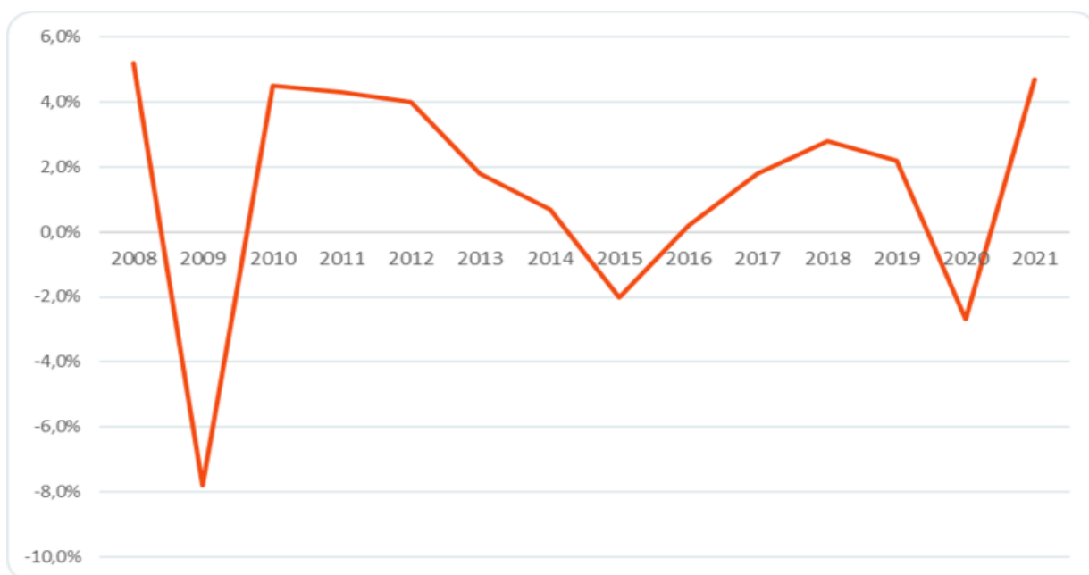
Рис. 1.