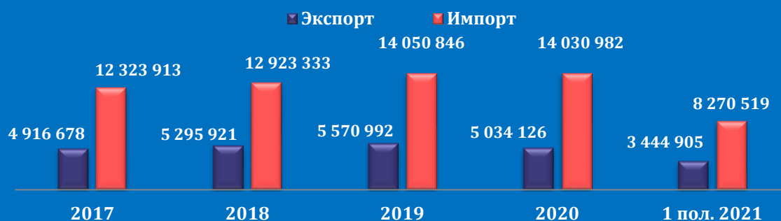
Динамика взаимной торговли Казахстана и России (тыс. $) 2017 - 2018 - 2019 - 2020 - 1 пол. 2021

Доля Казахстана в импорте России в 1 полугодии 2021 года составила 2,5234% против 2,0340% в аналогичном периоде 2020 года. По доле в российском импорте в 1 полугодии 2021 года Казахстан занял 9 место (в 1 полугодии 2020 года – 10 место).