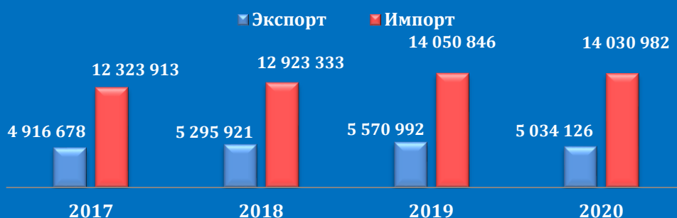
Динамика взаимной торговли Казахстана и России (тыс. $) 2017 - 2018 - 2019 - 2020

Торгово-экономические отношения между Республикой Казахстан и Российской Федерацией традиционно носят стабильный, прочный характер и отличаются высоким уровнем всестороннего взаимодействия. Россия является главным торговым партнером Казахстана, объем товарооборота Казахстана с Россией в общем объеме внешней торговли Казахстана за 2020 год составил 21,4%.